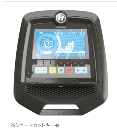
※ショートカットキー有