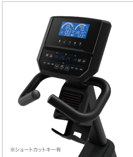
※ショートカットキー有