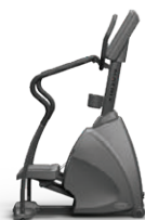
ステッパー エンデュランス