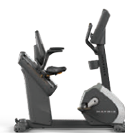
ハイブリッドサイクル