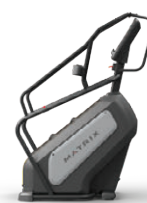
クライムミル エンデュランス