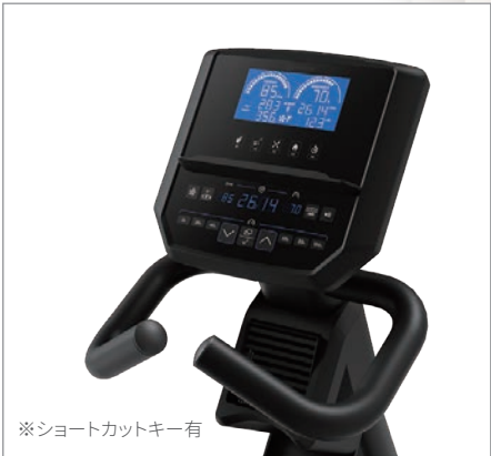
※ショートカットキー有