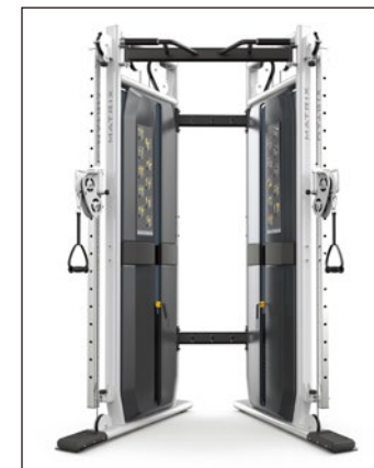
ストレージのないタイプ (VS-VFT-S18) もあります。 サイズ: 114x160x238 cm