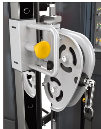
片手でもスムーズに調節できるケーブルプーリー (ハンドル付属)