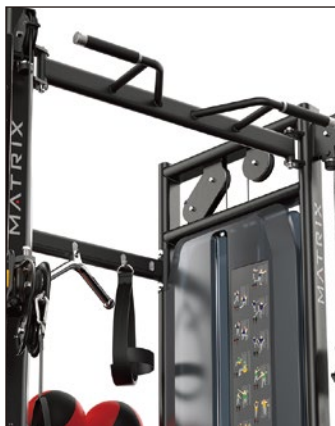
エクササイズのバリエーションを広げるマルチポジション懸垂バー