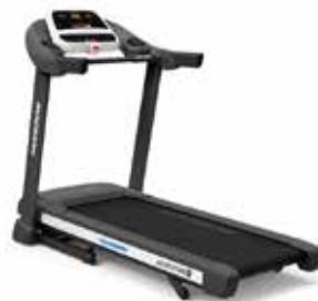
NEW TREADMILL ADVENTURE 1

家庭用ブランドホライズンからは、現行の人気商品に加えて2016年発売予定のモデルをいち早く展示します。最新のトレッドミルやクロストレーナーを、ぜひこの機会にご体験ください!