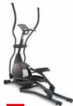
NEW CROSS TRAINER ANDES 3