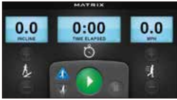
大きな数字とボタンで分かりやすい操作画面

緩やかにカーブのかかった長いハンドレールによって、中高年やリハビリ中の方でも安全に乗り降り・走行できます。最低速度は0.16km/hと超低速を実現し、高齢者にも安心なトレーニング環境をサポートします。