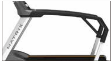
長いハンドレールで高齢者の乗り降りも安全