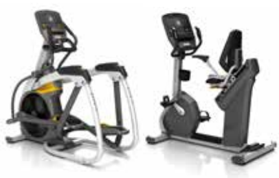
A7xi Ascent Trainer H7xi Hybrid Cycle

トレッドミルだけでなく、アセントトレーナーやバイクにも搭載。既に導入いただいた施設も、ネットから無料アップグレード可能です。